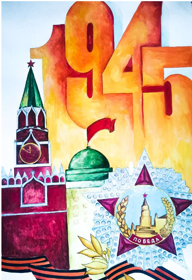
рисунок Ксении Зворыкиной, 9-4

День Победы - «праздник со слезами на глазах». Великая Отечественная война оставила свой след в судьбе каждого. Нет семьи, которую не затронули страшные события. 9 Мая мы благодарим тех, кто невероятным трудом - и в тылу, и на фронте - одержал победу и постоял за Родину, за наши жизни, за будущее страны. В этом выпуске «Тринашки» не будет рубрик: стихи, эссе, рассказы посвящены Великой Победе.